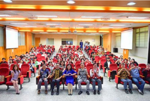
▲ 國際週開幕式大合照

由招生及國際合作處主辦之「114學年度國際週」於12月盛大舉行，為期四天的系列活動已圓滿落幕。活動期間校園充滿多元文化氛圍，吸引眾多師生踴躍參與，展現本校推動國際化教育與校園多元共融的具體成果。本次國際週活動內容豐富多元，包含開幕式、異國美食展、趣味闖關活動、國際歌唱擂台賽、書法文化體驗及閉幕式等，透過輕鬆活潑的活動形式，促進本國學生與國際學生之間的交流，深化跨文化理解。