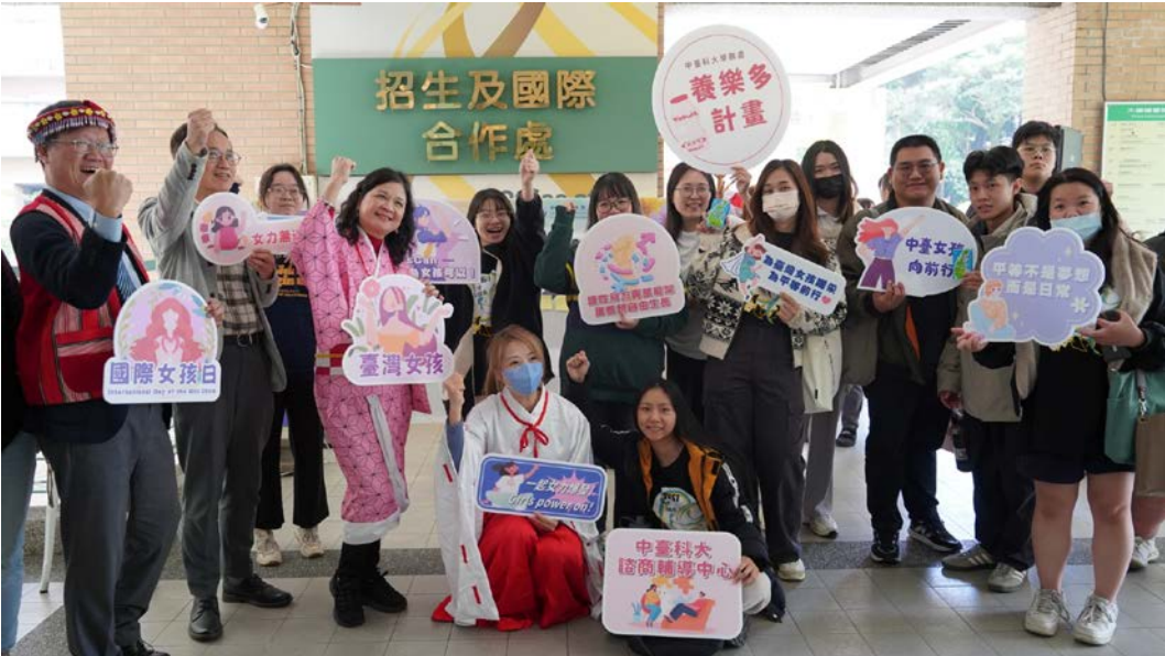
▲中臺科大辦「臺灣女孩日在中臺—Shout out to the girls」活動 響應國際女孩日