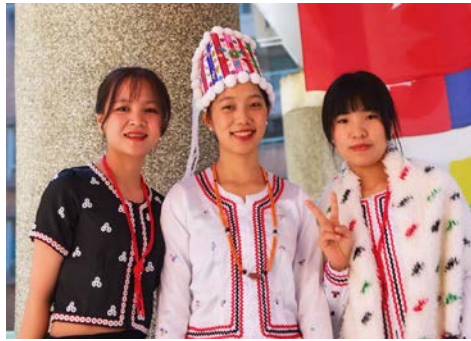
▲ 緬甸學生穿著傳統服裝

國際週首日舉行開幕式，由師長與國際學生身著各國傳統服飾共同進場，呈現多元文化交融的校園景象，象徵國際週正式啟動。陳錦杏校長於致詞中表示，國際週的舉辦能夠拓展學生國際視野，促進文化交流，並營造友善且安心的學習環境，期許學生在全球化時代中培養尊重多元與國際競爭力。活動第二天推出「越南×緬甸美食展」，提供越南咖哩河粉、哈密瓜牛奶，以及緬甸茶葉沙拉與奶茶，吸引師生透過味蕾認識異國飲食文化。同日舉辦的「勇闖三關」趣味闖關活動，包含謎題挑戰、肢體表演及語言創作等關卡，鼓勵學生以團隊合作方式參與，在互動中增進彼此認識與文化交流。第三天舉辦「國際歌唱擂台賽」，來自不同國家的學生以多元曲風展現歌唱實力，現場氣氛熱烈，充分體現音樂無國界的精神。同步進行的印尼美食展提供印尼雞肉香菇麵、荔枝冰茶及傳統甜點，讓師生在品嚐美食的同時，更加認識印尼的文化特色。