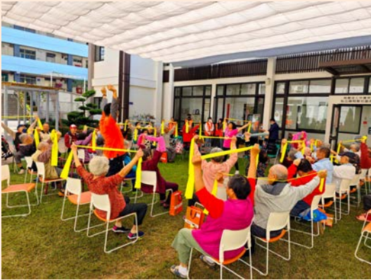
▲ 謙和賀日照中心長輩們活力四射的動感展現，贏得全場熱烈掌聲，充分展現課程的成效與活力