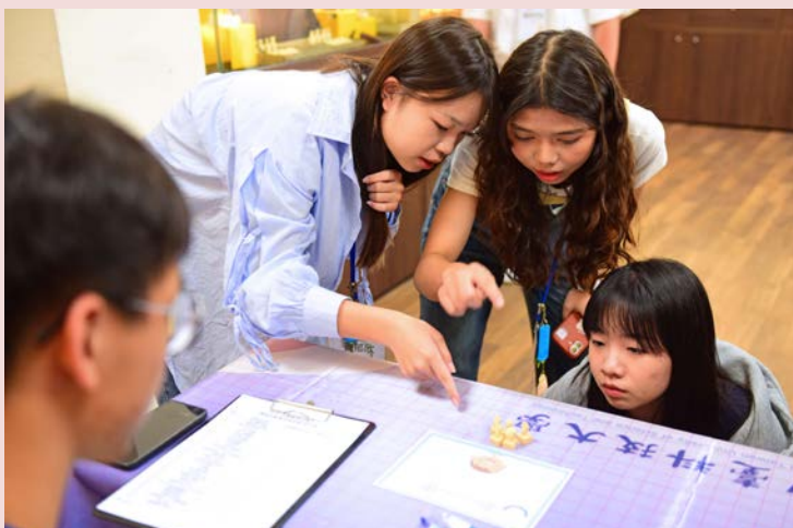
▲ 大健康產業職場新知，進行各系闖關活動

中臺科大始終秉持「技術專業、人文關懷、永續創新、社會服務」的教育理念，此次競賽正是這些理念的完美實踐。透過五大系傳承嚴謹醫護職能，並引導學生理解生命價值，結合趨勢激發學習動能，進而培育未來健康守護者。此次活動具體對應「SDG 4優質教育」與「SDG 17促進目標的夥伴關係」，成功串聯產官學力量，未來將持續深化與產業合作，與各界共創健康永續未來。