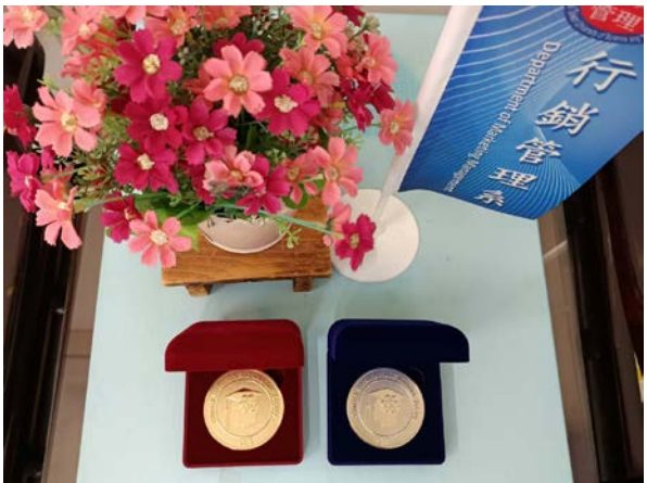
▲行銷行獲獎之金、銀獎牌