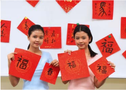
▲ 國際學生參與筆尖藝術派對