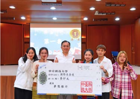
▲ 泰國料理組獲得國際美食展第一名