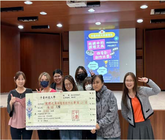
▲護理之美微電影創作比賽第二名與護理系師長合影