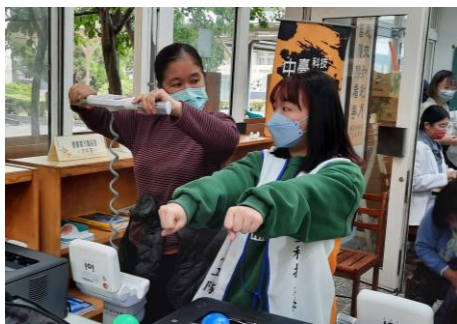
▲ 本校護理系學生與民眾操作說明「ioi身體組成分析」

元宵節過後春節假期邁入尾聲，112/2/6日中臺科技大學健康照護服務團隊，邀集國立北港高級農工職業學校服務利他團隊及敏惠醫護管理專科學校社區服務團隊，共同辦理「北農敏惠加中臺、照顧健康門陣來」聯合健康照護服務活動，活動當天除特別邀請嘉義信賴眼科賴麗如醫師、臺中市驗光師公會、中臺視光系系友團隊、雲林縣驗光師公會前往北港高級農工職業學校圖書館共襄盛舉，並規劃臺中大坑名產魚丸伯現場製作虱目魚肚粥與民眾分享，讓現場參與民眾門陣來，作伙顧健康！