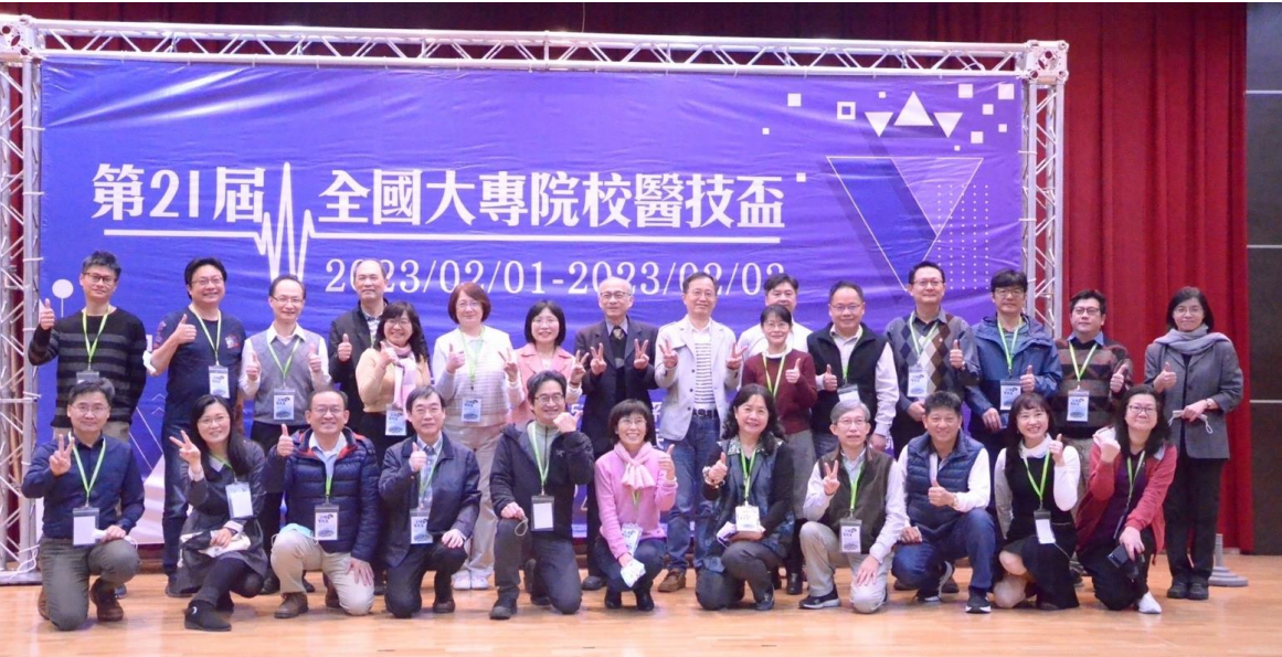
▲ 全國醫技系主任大合照

2023第二十一屆全國醫技盃於2月1日(三)在本校盛大舉行，共有16校20隊參賽。