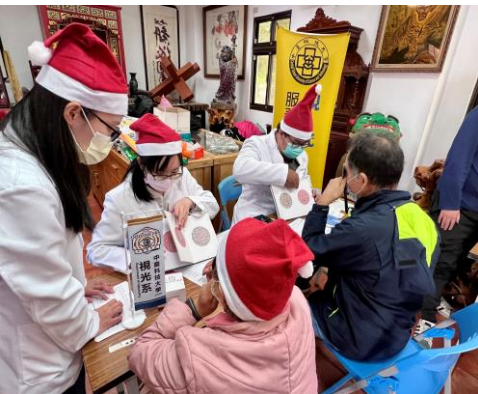
▲視光系同學認真為民眾解說

另，本校附屬機構 - 謙和賀日間照顧中心暨居家長照機構亦熱情參與，現場提供民眾關於長照2.0之諮詢，活動現場充滿著歡樂溫馨氣氛，參與民眾開心的表示，這場活動除可免費接受專業的健康服務之外，更可以透過專業醫師、機構人員的諮詢獲得喜樂的交流互動，這是一場備受肯定與讚賞的高水準活動。