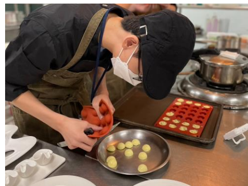
▲ 參賽學員應用模具讓餐食更精緻