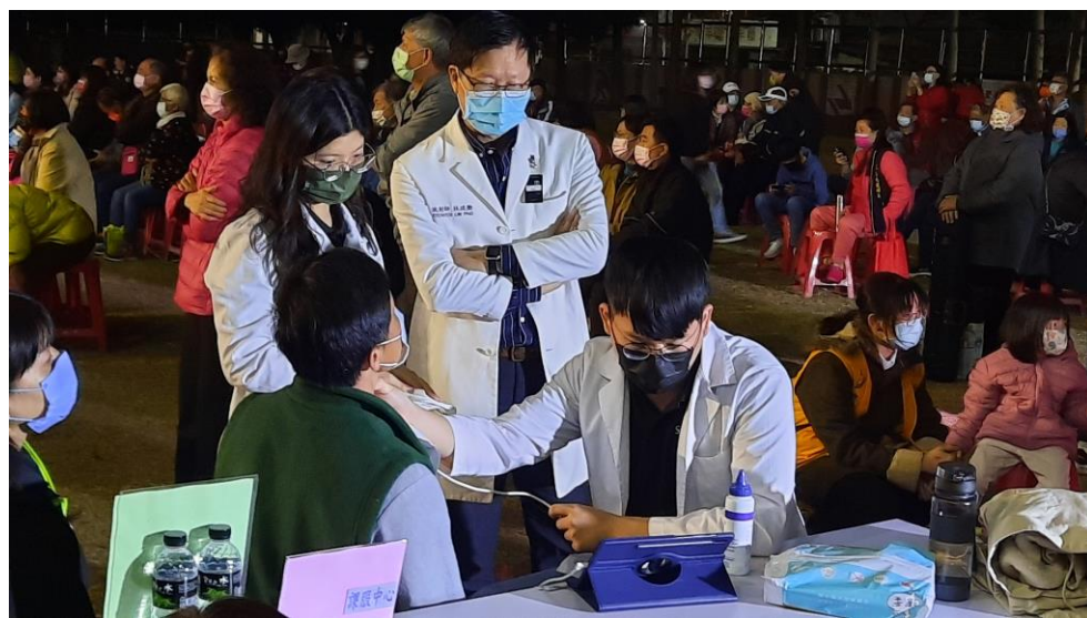
▲中臺健康服務團隊使用甲狀腺超音波讓民眾體驗

歲次邁入金兔年，農曆春節迎來壓軸的元宵佳節，元宵節又稱小過年，家家戶戶吃元宵、賞花燈、猜燈謎，祈求新的一年圓圓滿滿，正式開啟新年篇章。新年新氣象，此時雖正逢校園寒假期間，但中臺科大服務不打烊，在112年2月4日(六)晚上，與北屯區三公里辦公室、社團法人臺中市北屯區三光社區發展協會於三光國中一同舉辦「玉兔迎春-燈你逗陣來」元宵晚會活動。近年來因疫情影響，已停辦兩屆的三光元宵晚會活動，今年終於邀集社區鄰里再度舉行，在熱鬧非凡的精彩活動中，除了有晴空舞蹈班的舞蹈表演與三光社區銀髮手鼓樂團的銀髮手鼓展演外，中臺科大也派出兩大社團「M.I.C.T熱舞社」跟「原住民瘋年社」一同共襄盛舉，同學們使出渾身解數，在寒冷的夜晚裡，帶來熱歌勁舞與原住民樂舞表演，High翻整個會場，民眾們一起沸騰愉悅起來。