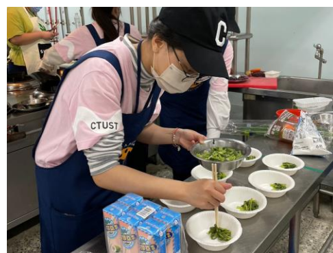
▲ 參賽學員進行餐食盛裝