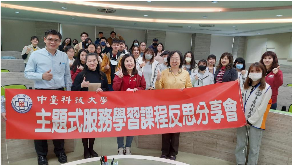
▲ 主題式反思分享會

本校積極推動服務學習，學生將專業課程或參與主題式社區服務結合服務學習，透過「做中學」、「學中做」，體驗服務學習精神與價值。於12月21日與12月28日兩天分別舉辦主題式與專業式服務學習反思分享活動，邀請本學期有參與社區服務之師生，進行成果分享與競賽活動。服務學習的四大歷程「準備、服務、反思、擴散」，其中的反思最為重要，透過服務後的反思，讓學生思考服務過程中所學、所見、所聞為何，因此邀請各團隊分享如何將所學融入服務學習以及服務的過程中所發生的感動，彼此互相交流與學習，做為未來設計活動的依據，並提升學生公民素養，實踐社會責任。