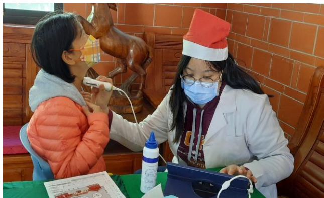
▲醫放系同學為民眾服務甲狀腺超音波檢查